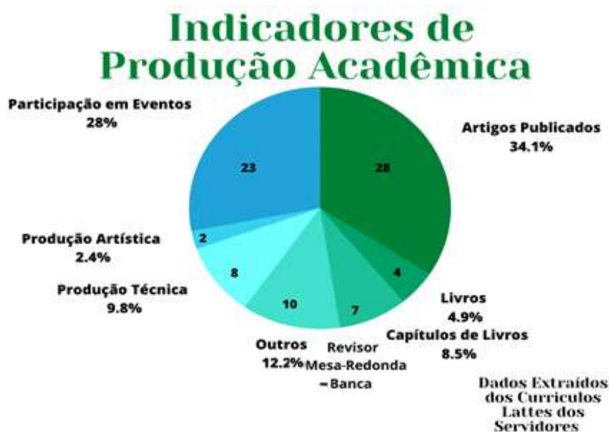
Gráfico 1 – Indicadores da Produção Acadêmico-Científica dos Servidores do Campus – Ano 2020

Fonte: Plataforma Lattes – CNPq. Quadro elaborado pela CPq (2020).