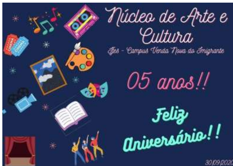
Figura 1 – Homenagem aos 5 anos do Campus Venda Nova do Imigrante

Fonte: Cartão elaborado por Suzana Grimaldi – Secretária do NAC.