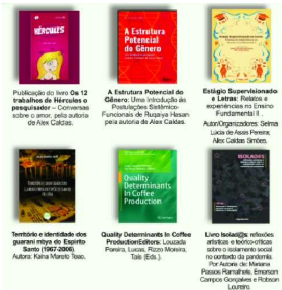
Figura 2 – Livros publicados pelos servidores em 2020